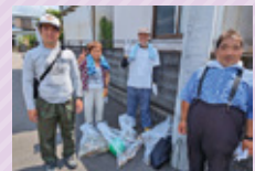
地域のゴミ拾い ボランティア活動

● グループホームは、全12ホームに72名の利用者様が暮らしており、職員は看護職員、夜間支援員を含む64名が配置されています。障がいを持つ利用者様が、地域で安心して自立した生活を送れるよう「利用者職員がともに」をモットーに家庭的な雰囲気の中で日常生活や社会参加の支援を提供しています。