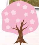
生活介護恒富事業所の遠足の様子