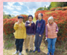
日之影のつつじ見学

● 月に1回、社会参加活動で園外へお出かけをしています。皆さん、おいしいものを食べたり、珍しいものを見たり、お買い物をされたりと、とても楽しい時間を過ごしています。