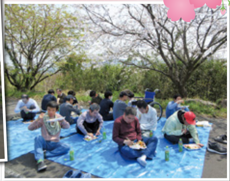
入所部のお花見遠足