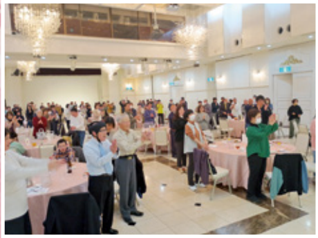
ガーデンベルズ延岡にて グループホームの 花見会の様子

各事業所で利用者様と職員の参加による「遠足」「花見会」が開催されました。満開の桜の下でお弁当を食べたり、写真を撮ったりと楽しい時間を過ごすことができました。利用者様も職員も美味しい食事と楽しい会話に笑顔の花が満開でした。